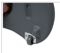
Pieds réservoir avec roulette

Les gabarits d'impression mis à disposition sont fournis à titre indicatif. Ils tiennent compte de procédés internes qui peuvent varier selon vos équipements, matières & finitions. En cas d'impression par vos soins, il vous appartient de tester au préalable la compatibilité de votre media avec le produit avant utilisation.