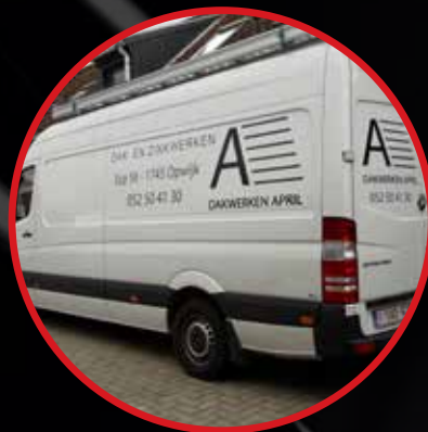
Print & Sign