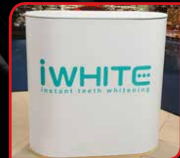
Comptoir ou desk différents modèles et formes