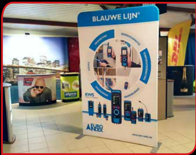
Formulate cadre en aluminium avec revêtement textile