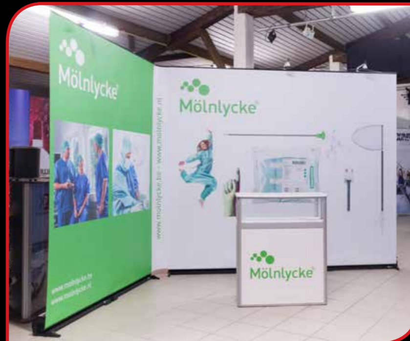
Link2 RollUp's RollUp sans couture à un mur flexible