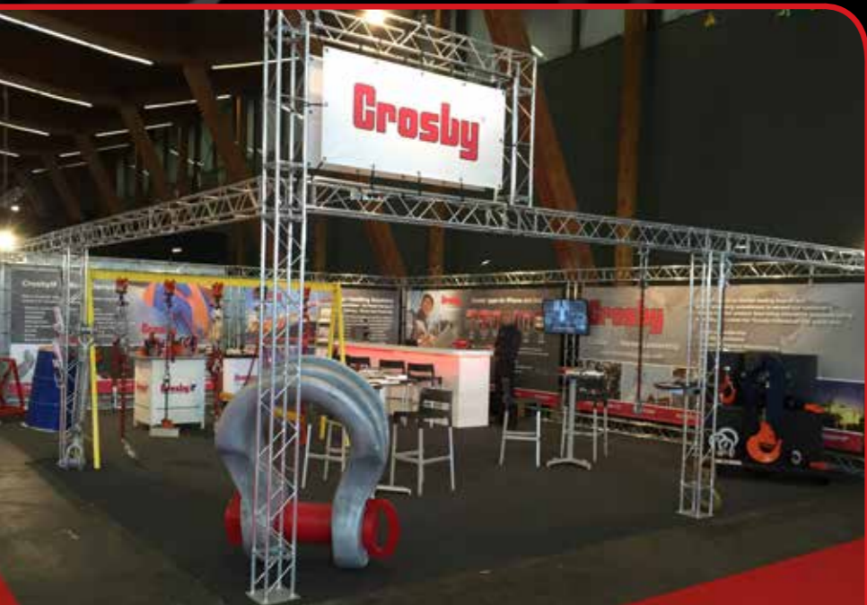
Arena4 frames en aluminium, pour un stand sur taille