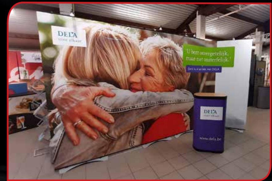
FlexiLink bannière mur flexible 4.5m avec coffre convertible