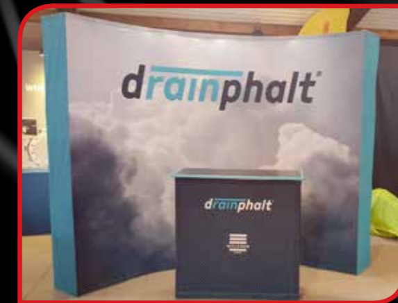
PopUp Textile + comptoir textile