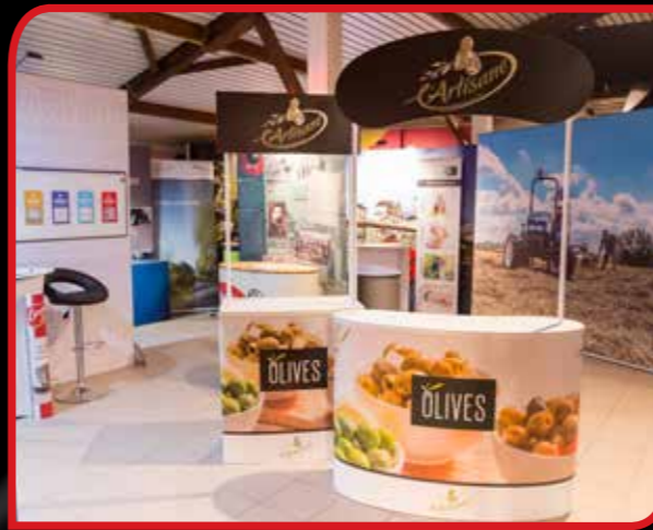
Promotor stand de dégustation budget ou Premium