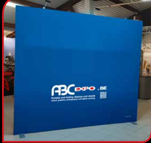
Vector cadre alu avec tissu textile