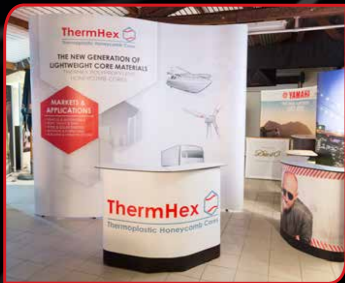
PopUp mur 's-shaped' 4 x 4m avec coffre/comptoir