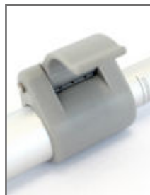
Mât hybride télescopique