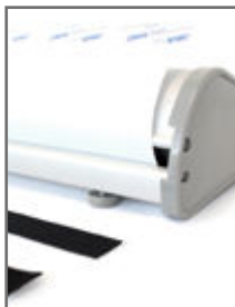
Amorce adhésive ou velcro