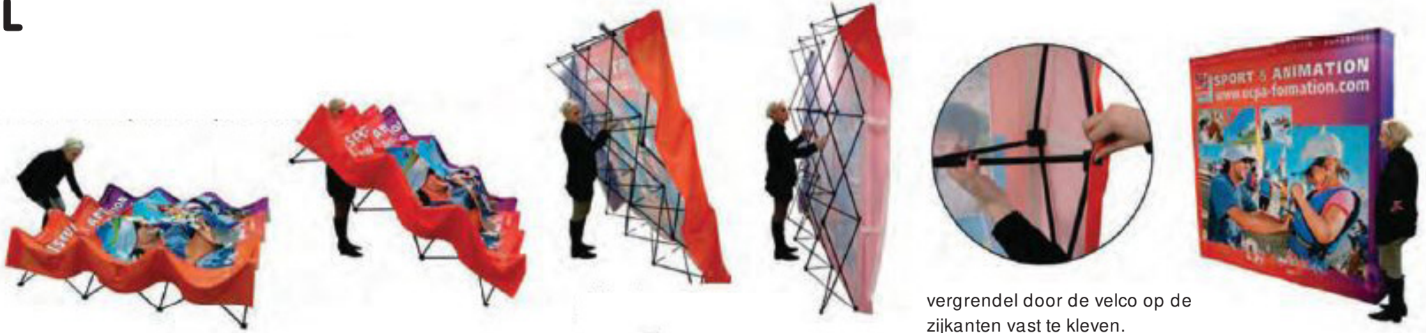
vergrendel door de velco op de zijkanten vast te kleven.

OPBOUW open het frame aan de achterzijde door de armen open te spreiden.