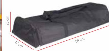
Sac de transport inclus