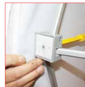
Fixation du visuel par velcro