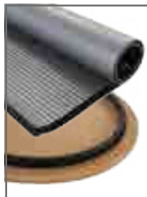
Montage de la jupe