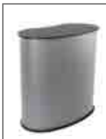
Produit avec tablette noire