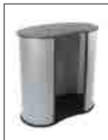
Comptoir - Dos