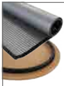
Montage de la jupe